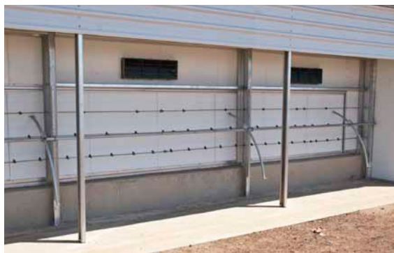
Spraykølesystemet monteret udenpå huset.