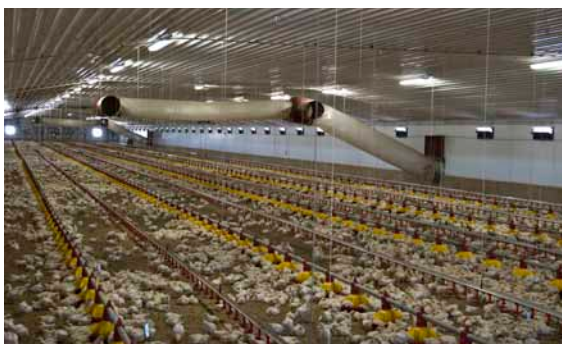
Varmesystemet fra de to kulfyrede enheder udenfor stalden.

Der bruges medicin mod salmonella, og der er altid lidt klor i vandet.