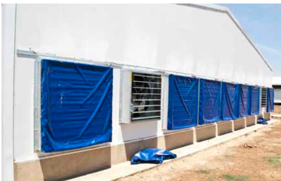
De 9 ventilatorer i bagenden af huset.