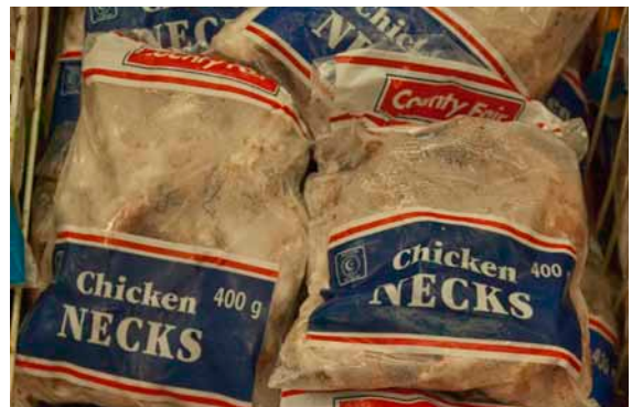
Frosne kyllingehalse til 7,99 rand (ca. 5,50 kr.) for 400 g. jnl