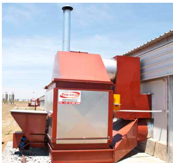
De to kulfyrede varmekilder til kyllingestalden.

Jeg besøgte en slagtekyllingefarm ca. 50 km nord for Johannesburg.