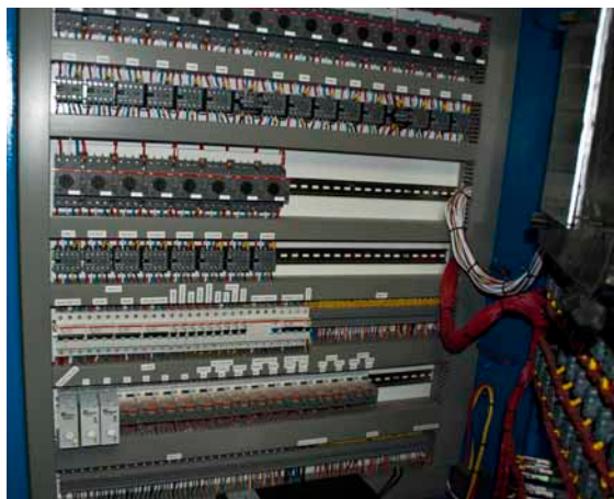
Indmaden i styringen.