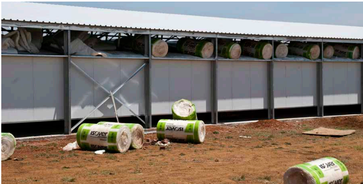
Der isoleres med 160 mm glasuld.