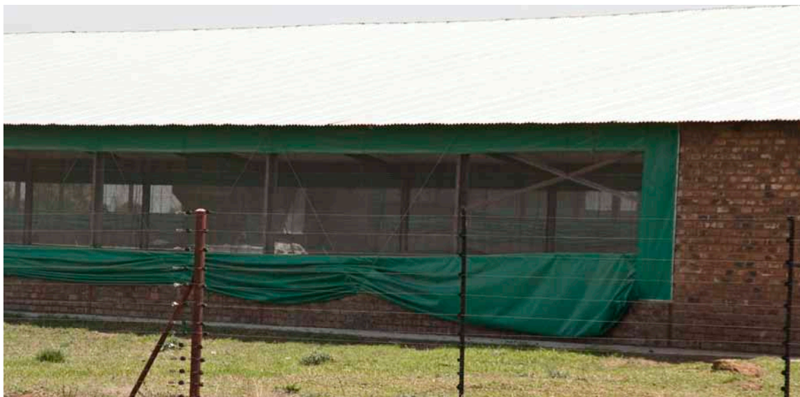
Slagtekyllingehus med netsider og naturlig ventilation.

tere i et for stort vægttab under transporten.