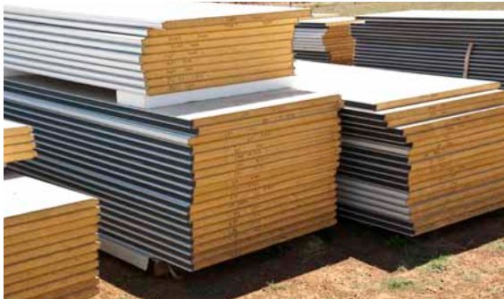
Elementer til væggene i det nye kyllingehus.

Den nyeste type er huse bygget af kølehuselementer med moderne computerstyret ventilation. Der er 75 mm skumisulering i siderne og 200 mm isolering i loftet. Der er oftest 6 huse pr farm med 40.000 kyllinger pr hus. Byggeomkostninger ligger