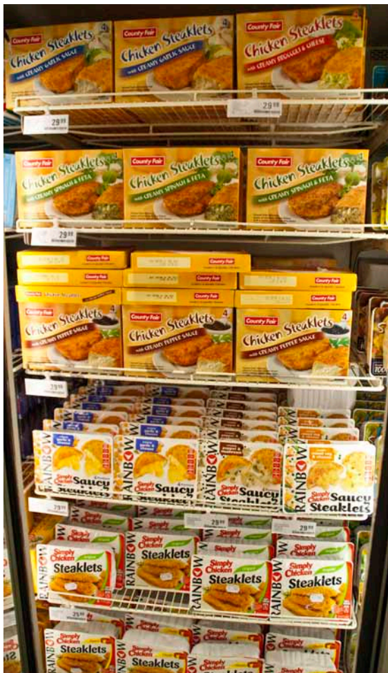
Stort udvalg i færdigretter med kylling.

Hele huset er computerstyret fra et anlæg med touchscreen. Styringen er samlet i en enhed bygget i Sydafrika af en ung elektiker - Estiaan van Deventer. Farmen har en generator med batteri som back up.