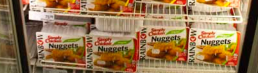
Stort udvalg i convenience produkter med kylling.