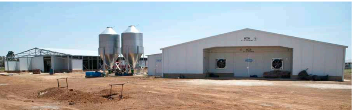
De 2 nye huse på den moderne slagtekyllingefarm.