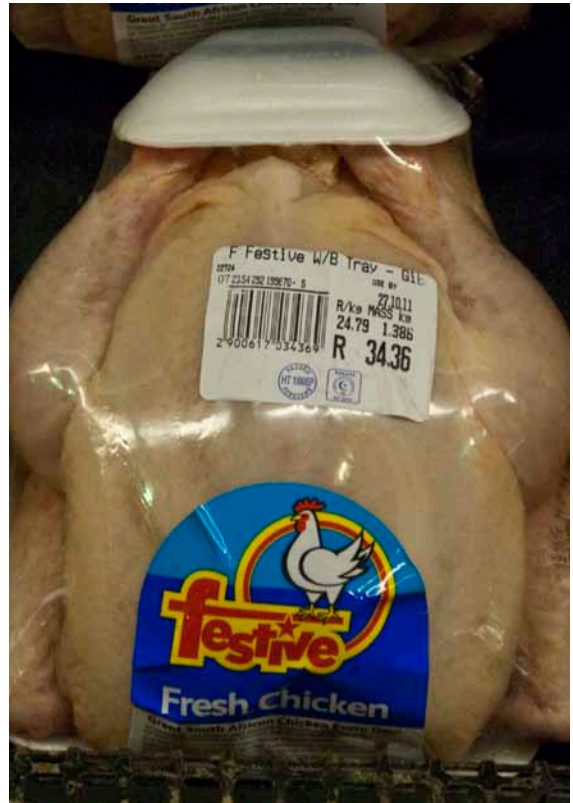
Hel fersk kylling til 24,79 rand (16,50 kr.) pr. kg.