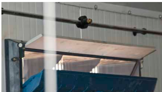
Højtryksdysen monteret over indsugningsventilen.