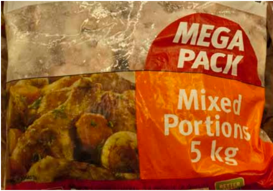
5 kg parteret frossen kylling til 99,00 rand (ca. 66,00 kr.).