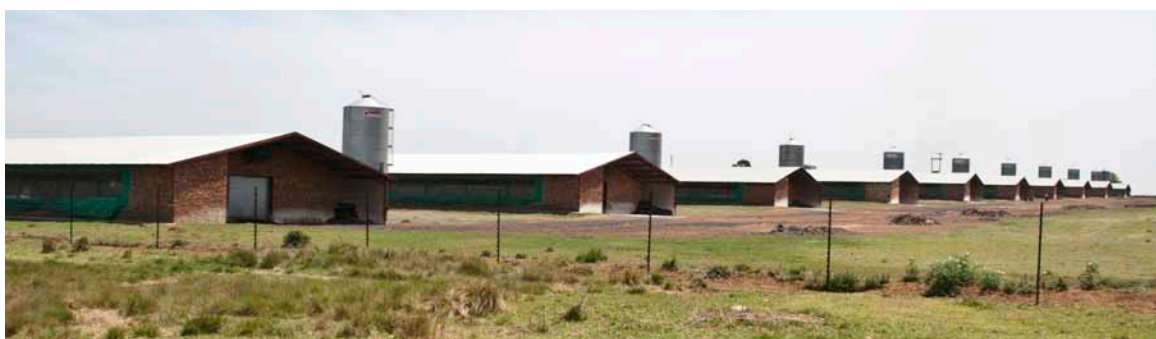
Farm med 10 slagtekyllingehuse af den ældste type.

I Sydafrika ligger priserne på landbrugsjord fra 1.000 rand (ca. 670 kr.) pr ha (dårlig majsjord uden vanding) til 200.000 rand (ca. 135.000 kr.) pr ha (vingård). →