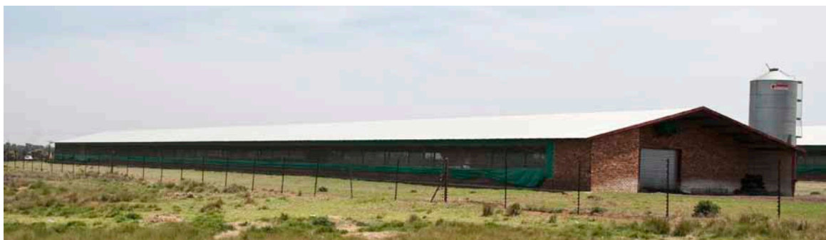
Den ældste type slagtekyllingehus i Sydafrika.