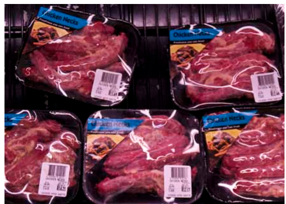
Ferske kyllingehalse til 33,99 rand (ca. 22,75 kr.) pr. kg.