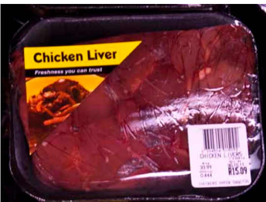
Ferske kyllinglever til 33,99 rand (ca. 22,75 kr.) pr. kg.