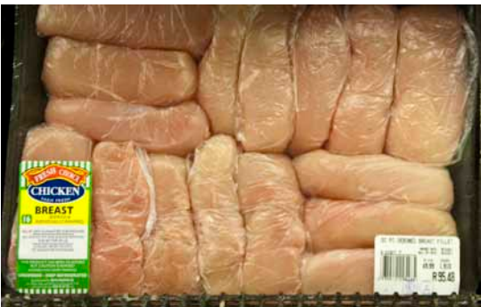
Ferske kyllingebryster pakket enkeltvis til 49,99 rand (ca. 33,50 kr.) pr. kg.