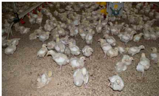
De 11-14 dage gamle kyllinger.