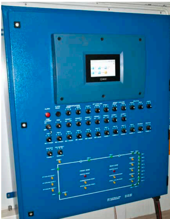
Hele styringen er samlet i én enhed.