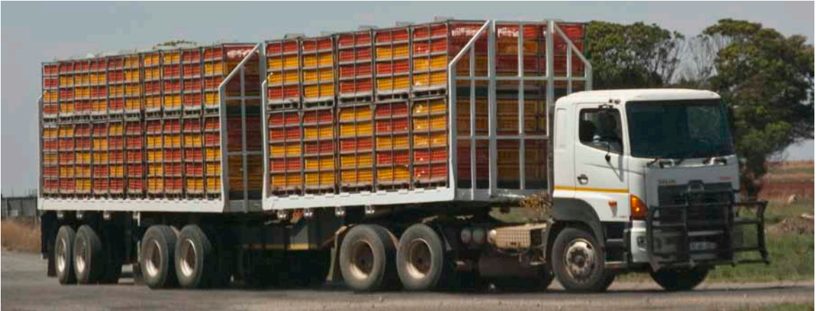
Transport af kyllinger til slagteriet.