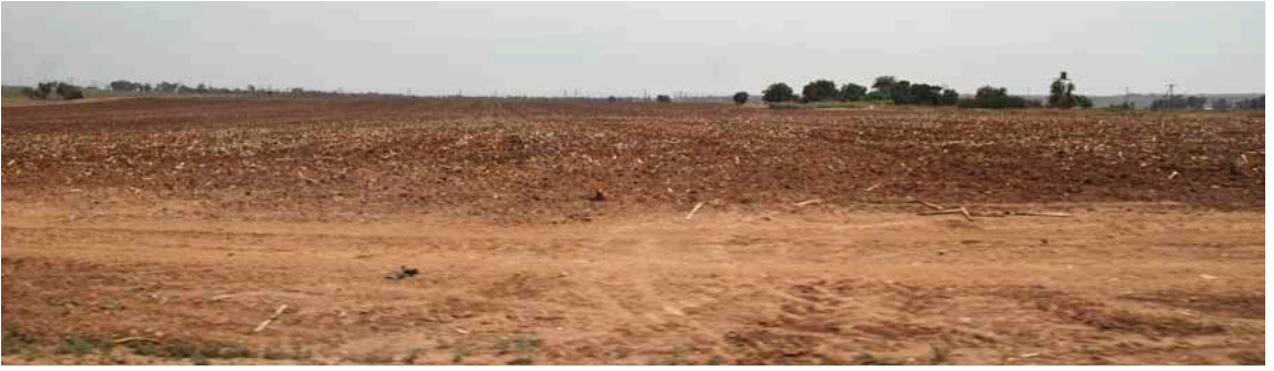
Markerne på highvelt pløjes om foråret, før de sås. Majs sås i oktober-november og høstes april-maj.