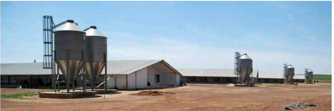
De 4 ældste huse på den moderne slagtekyllingefarm.