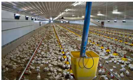
Stalden med de 11-14 dage gamle kyllinger.

Der er ingen ventilation gennem taget, men der