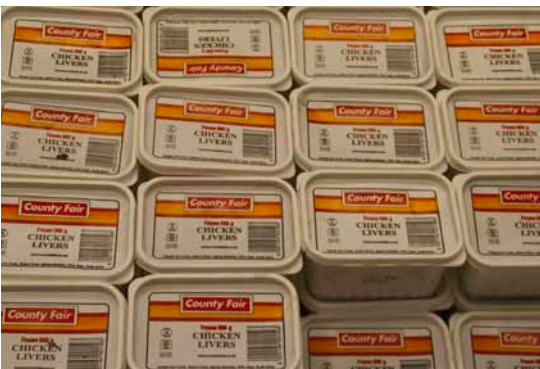
Frossen kyllinglever 13,99 rand (ca. 9,50 kr.) for 500 g.