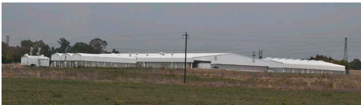
5 år gammelt rugeri til slagtekyllinger tilhørende Early Bird. De har hovedsagelig dyr fra Ross inkl. forældre- og bedsteforældredyr.

Farmene ligger normalt højst 60 km fra slagteriet, fordi man vurderer, at en længere afstand vil resul-